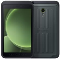
Galaxy Tab Active5 EE 5G WiFi+Cellular 128GB