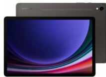
Galaxy Tab S9 Ultra 5G 256 GB / 1TB