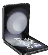
Galaxy Z Flip5 256GB / 512GB