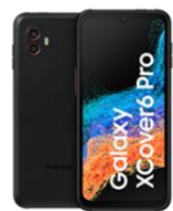
XCover 6 Pro 128GB