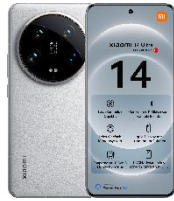
14 Ultra 512GB