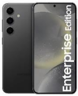
Samsung Galaxy S24 EE 128GB