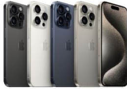
iPhone 15 Pro 128 GB / 256 GB / 512 GB