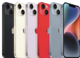
iPhone 14 Plus 128 GB