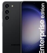
Samsung Galaxy S23 EE 128GB