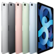
iPad Air (5. Gen) WiFi+Cellular / WiFi only 64 GB / 256 GB