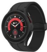
Samsung Galaxy Watch 5 Pro LTE 45 mm