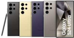
Samsung Galaxy S24 Ultra 256GB/ 512GB