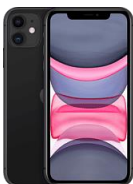
iPhone 11 64 GB / 128 GB