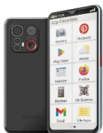
Emporia Smart.6 128GB