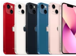
iPhone 13 128 GB / 256 GB