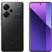
Redmi Note 13 Pro+ 5G 256GB