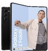
Galaxy Z Fold5 512GB