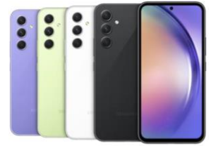
Galaxy A54 5G / EE 128GB