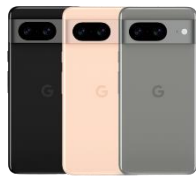
Google Pixel 8 128GB