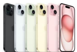
iPhone 15 128 GB / 256 GB