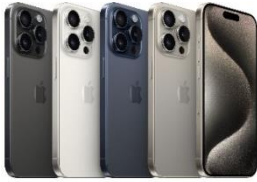
iPhone 15 Pro Max 256 GB / 512 GB / 1TB