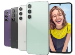
Galaxy S23 FE 128 GB