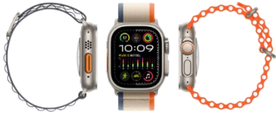
Apple Watch Ultra 2 49 mm