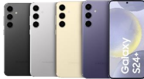
Samsung Galaxy S24+ 256GB/ 512GB