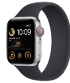
Apple Watch SE2 40mm / 44 mm