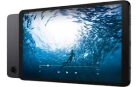
Galaxy A9 LTE/WiFi Galaxy A9+ 5G 64GB