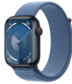
Apple Watch Series 9 LTE 41mm / 45mm