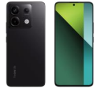
Redmi Note 13 Pro 5G 256GB