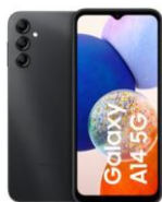
Galaxy A14 5G 64GB