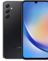
Galaxy A34 5G / EE 128GB