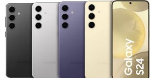
Samsung Galaxy S24 128GB/ 256GB