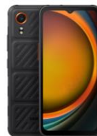
Galaxy XCover7 EE 128GB