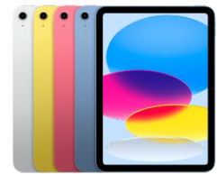
iPad (10. Gen.) WiFi+Cellular / WiFi only 64 GB