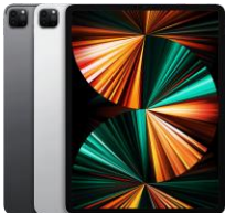
iPad Pro 12.9 5G (6. Gen) WiFi+Cellular / WiFi only 128 GB / 256 GB