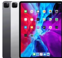
iPad Pro 11 5G (4. Gen) Wifi+Cellular / WiFi only 128 GB / 256 GB