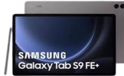
Galaxy Tab S9 FE / FE+ 5G 128GB