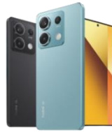
Redmi Note 13 5G 256GB