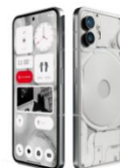
Nothing Phone 2 256GB