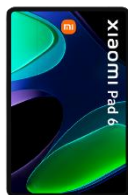
Xiaomi Pad 6 128GB