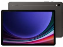
Galaxy Tab S9 / S9+ 5G 128 GB / 256GB