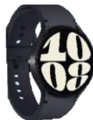
Samsung Galaxy Watch6 LTE 40mm / 44mm