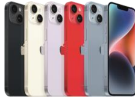
iPhone 14 128 GB / 256 GB