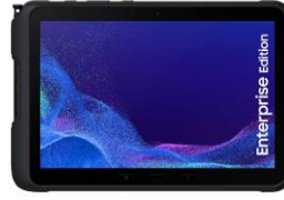
Galaxy Tab Active4 Pro 5G EE WiFi+Cellular 128GB