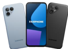
Fairphone 5 256GB