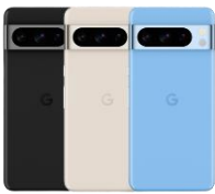
Google Pixel 8 Pro 128GB / 256GB / 512GB