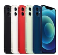
iPhone 12 64 GB / 128GB