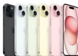
iPhone 15 Plus 128 GB / 256 GB